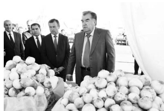
фаровонлигини юксалтириш учун ердан самарали фойдаланишни амалга оширишга йўналтирилган.