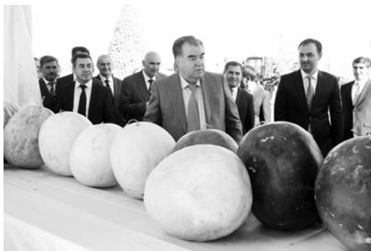
ва миллий бирлик асосини – Миллат пешвоси, Тоҷикiston Республикаси Президенти муҳтарам Эмомалӣ Раҳмон «Водни заррин» МҲЖ аграр бирлашмасининг самарали фаолияти билан танишиб, унинг ишчилари ва мутахассислари билан самий суҳбат утказди.

Янги ишчилик, жумладан, ҳарбий хизмат меъёрига мослаштириш тарзида қурилган аскарлар казармаларига таширғи чоғида мамлакат Президентини, Тоҷикiston