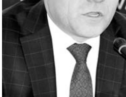
Ҳисобот даврида банк солиқ идоралари ҳисобидан бюджетга 23 миллион сомоний ўтказгани ҳақида маълумот берилиб, бу ўтган

йилги кўрсаткичдан 14 фоиз кўпдир. Банкда молиявий шаффофликни таъминлаш мақсадида, шунингдек, нақд пул муомаласини юксалтириш учун 255та савдо терминалларини мамлакатимизнинг шаҳар ва ноҳияларида ўрнатди. Амонатбанк раиси Руҳулло Ҳакимзоданинг қайд қилишича, аҳолидан электр энергияси, сув ва бошқа хизматлар ҳақи учун маблағ қабул қилишни йўлга қўйиб, маблағлар ўз вақтида тегишли идоралар ҳисобига ўтказилгани ҳақида айтиб ўтди.