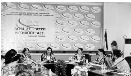
Жорий йилнинг 7-10 феврал кунлари комитет мамлакат олий таълим муассасалари студентлари билан аёллару эркеклар, ёшлар, балогатга етмаганлар ўртасида номмақул амаллар, жумладан, жиноятчилик, гиёҳвандлик, суиқасд каби иллатлар ҳамда хотин-қизлар ва ёшларнинг турли хил экстремистик ташилоту оқимлар сафига кириб кетишлари олдини олиш мақсадида учрашувлар ўтказилди.

Комитет Тожикистон Республикасининг «Оилада