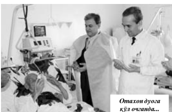
Отaxon дуога кўз очинди...

муна бўлди. Худо ғарқаси ҳеч гап эмаскан. 1994 йили муваддас Қазбага йўл олиб, ҳаж фароғини адо этди. Буни қарангки, келуси йили машҳур раис Абдуғафур ота Саматов у кишини ўз ҳисобидан яна бир бор Ҳаж зияратига юборди. Қамбар ота бу марта Шўрлолар даврида динг мизнинг ушбу рункини бажара олмаган дусту ёрлари, ота-онаси ҳамда Абдуғафур ота номига ҳажга бадални амалга ошириб қайтдилар.