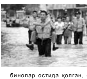
Бинолар остида қолган, 4 нафари чўшиб кетган, ана 16 киши ер кучиши ва бошқа сабаблар натижасида ҳалок бўлган.

Марказий Хитойдаги давомли сел ғамгрлари натижасида 1,2 миллион киши фалокат зонасида қолди. Бу ҳақда «Синхуа» агентлиги хабар берди.