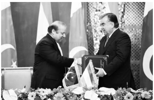
қим, дея аташди.

Тожикистон ва Покистоннинг олий даражада давом этактаган сиёсий алоқалари жараёнидан қониқиб эҳзор этган ҳолда, суҳбатдошлар икки давлатнинг дипломатик алоқалар ўрнатилиши 25 йиллиги давридаги муносабатлари замонавий тарихи учун эса қолари бўлган олий даражадаги учрашув ва сузлашувлари муҳим ҳамда самарали, дея таъкид.