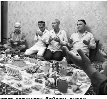
Эзгу тилақларга қоришган байрам дуоси

Сўнда давом этган дунди марказда Рамазон байрами муносабати билан доимий ҳамкорлик билан ҳамкорликда бўлиб, ўзаро китоб айирбошлашни ҳам йўлга қўйган. Дарвоқе, Судг вилоти раисининг 2009 йил 27 февралига 5-қарори асосида Толий Банкининг Ҳўжанддаги филиали ва «Жавоний» масъулияти чекланган жамияти муассислари комитети томонидан марказ эшик-мақчалари мунтазам қўлбўғуватлилик келинди.