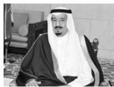
King Salman bin Abdulaziz Al Saud

«Саудия Арабистони қироли Салмон ибн Абдулазиз ал-Сауд мамлакатнинг Вашингтондаги элчихонасига янги раҳбар тайинлади. Янги элчи қиролнинг ўғли шахзода Халид бўлди».