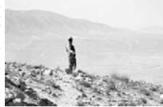
A person in a desert landscape

AQShning «Fox News» телеkanali AQSh mudofaa va-zirlikligida qabul qilingan maqolalarda iqtibos keltirilgan holda, IShIDning Suriyadagi poytaxti Raqqadani Daui az-Zurga kuchirilganini ma'lum qilgan.