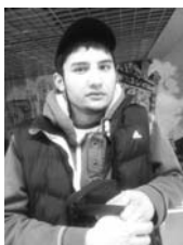
Жалиловдир. - Терговда Санкт-Петербург метросидаги вагонда