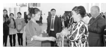
Бундан ташқари, 33-ўрта умумтаълим муассасасида футбол, волейбол, стоп теннис, шахмат, шаҳмат ва миллий кураш бўлими муассасалар уюштирилди.