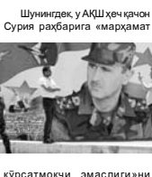
Шунингдек у АКШ ҳақ қочқан Сурия раҳбарига «марҳамат»