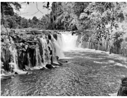
2,5 миллиард нафар киши, жумладан, 1 миллиард гўдак санитариядан фойдалана олмай...